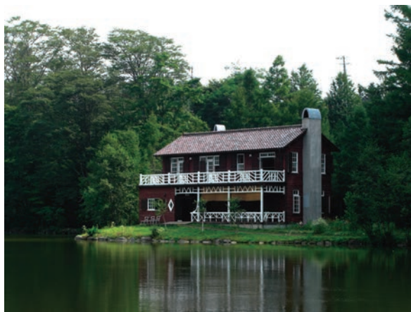
睡鳩荘 (ヴォーリス設計)