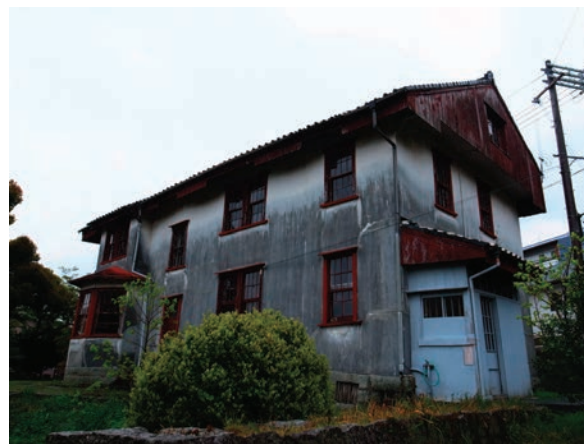
西村記念館 (西村伊作設計)