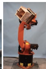
左:鋳型製型プロジェクト 右:ロボットアーム