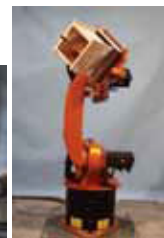
左:鋳型製型プロジェクト 右:ロボットアーム