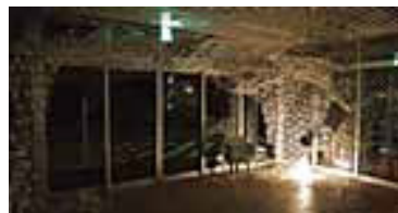
上:CAD/CAMラボ 下:Digital Cloud