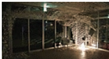
上:CAD/CAMラボ 下:Digital Cloud