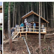
左・中:学生のデザインによる豊川稲荷門前景観整備で22年度に完成した2軒 右:豊根村交流拠点小屋“よらっせ”も学生による設計と地域と協働した施工により完成した